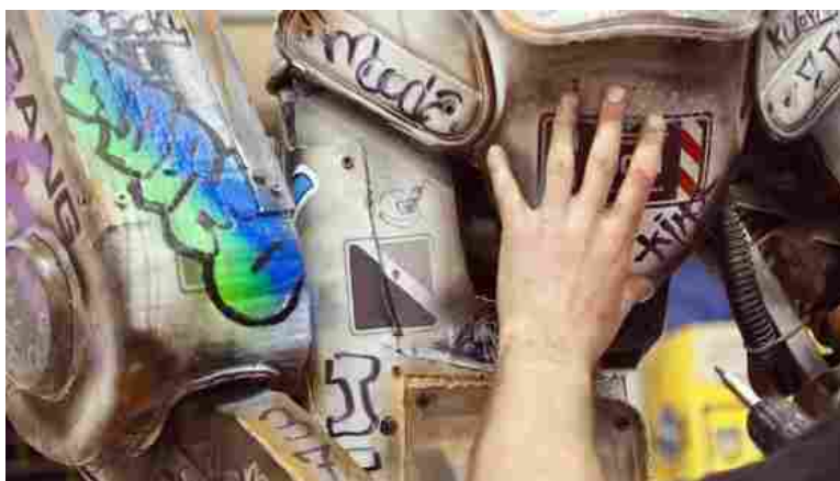
Consorzio creativo - Un'opera realizzata dall'artista LABADANzky

Giunto alla ventesima edizione, il format prevede lezioni magistrali, mostre, spettacoli, letture, attività per ragazzi e cene filosofiche da venerdì 18 a domenica 20 settembre. Ecco il programma e come prenotarsi