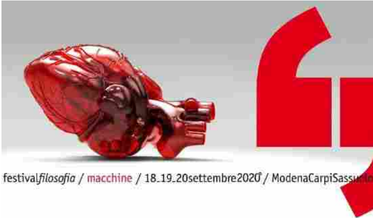
festival|filosofia / macchine / 18.19.20settembre2020 / ModenaCarpiSassuolo

Un cuore rosso, tecnologia e passione per celebrare il ventennale della manifestazione. Immagine realizzata da Ernesto Tuliozi